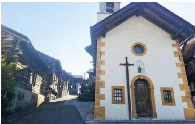
Une vue du vieux village de Haute-Nendaz et de sa chapelle du XV e siècle. J'aime particulièrement le traverser, m'imaginer ses habitants d'autrefois mais aussi toutes les belles choses qui restent à y faire.