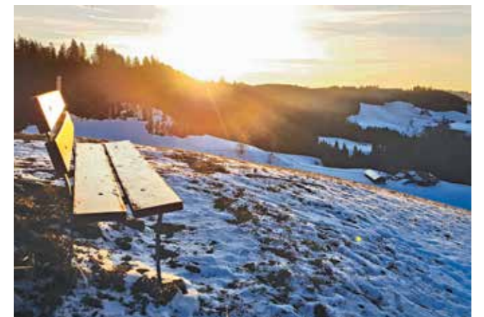
A la ferme Niederried, le calme et le cadre idyllique offrent une qualité de vie indescriptible.

«C'est devenu difficile financièrement et j'ai commencé à chercher de l'aide.» Il trouve l'adresse de la Fondation Pestalozzi sur le site stiftungschweiz.ch . David a perçu des bourses de la Fondation Pestalozzi pendant trois ans et en est «extrêmement reconnaissant». En 2018, il a obtenu le Bachelor of Arts à la FHNW en design produits et industriel et a même remporté un prix d'encouragement pour son mémoire. Actuellement, David travaille temporairement comme menuisier. Bientôt, il partira pour un voyage en Amérique du Sud, lors duquel il effectuera un stage dans un studio de design à Medellín, en Colombie. Il n'y gagnera pas grand-chose, mais rassemblera un grand nombre de nouvelles expériences.