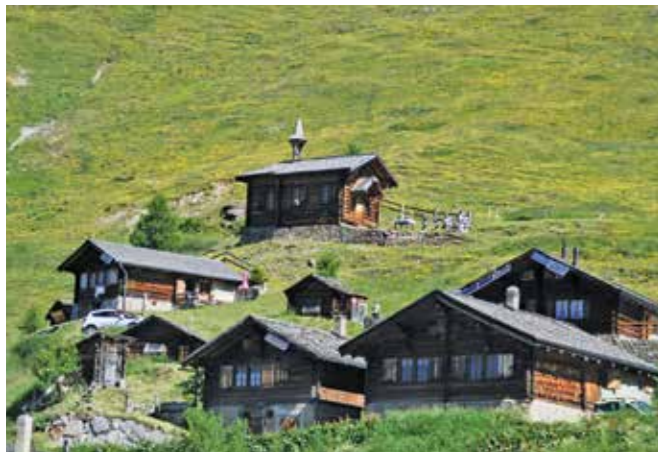
Vue sur l'alpage de Torrent et sa chapelle.