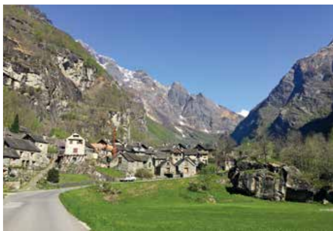
Sonlerto, le village où j'ai passé tous mes étés.

Pendant les vacances, lorsqu'il lui reste du temps, Ambra effectue de petits jobs. Elle dépend cependant des bourses du canton du Tessin, où on lui a remis une liste de fondations qui soutiennent les jeunes dans leur parcours éducatif. Elle a pris contact avec la Fondation Pestalozzi, a rempli les formulaires, s'est procuré les documents nécessaires et a obtenu sans tracasseries administratives des bourses qui l'aident énormément. Ambra vit à peu de frais dans une colocation de sept personnes à Fribourg. «Nous faisons les courses et cuisinons ensemble, raconte-t-elle, les frais sont partagés.» Pour son mémoire de master, spécialisation enseignement spécialisé, elle souhaite prendre son temps, car le sujet de l'insertion professionnelle de personnes en situation de handicap lui tient beaucoup à cœur. Bien évidemment, la jeune Tessinoise déterminée aimerait travailler dans un pays de langue latine, de préférence en tant qu'enseignante dans le domaine de l'intégration scolaire.